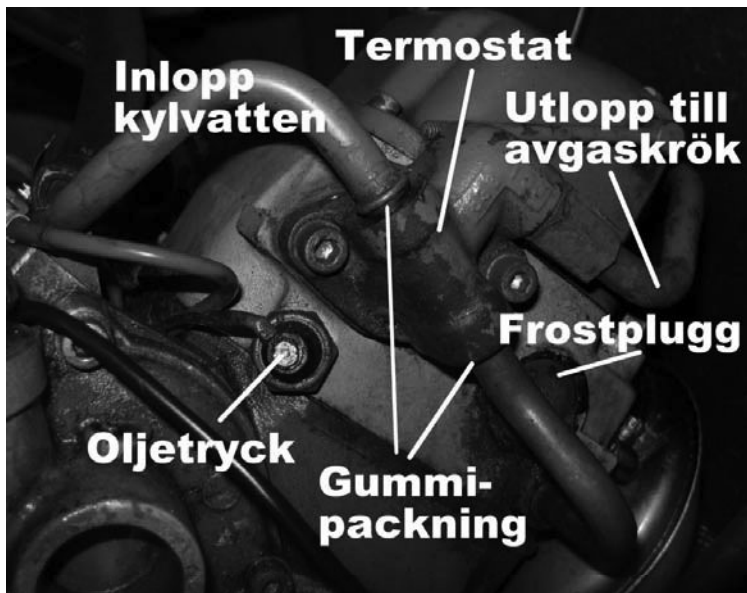
Bild 5.3, Termostaten är placerad under locket (termostathuslock). På bilden ser man det gamla numera utbytt termostatlocket.