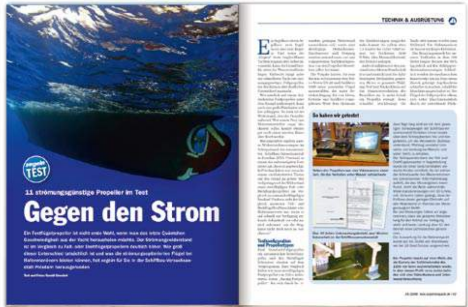
Gab begründeten Anlass zum Grübeln und ärgern: Propellertest „Gegen den Strom“

Erhält dank neuer Werte einen Tipp: Flex-O-Fold