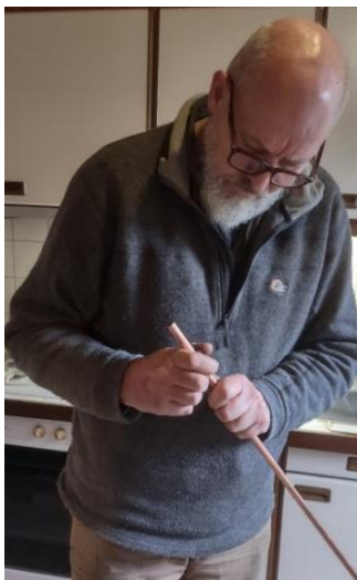
12mm koperen buis op de juiste lengte snijden.

Zaag of snij de 12mm koperen buis op de juiste lengte. (Marifoon noodantenne op 960mm en de AIS antenne op 925mm)