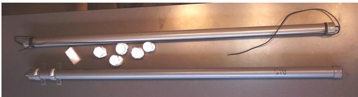
Spacers van polyethyleen schuim

In plaats van de Pvc buis vol te schuimen kunnen er ook polyethyleen spacers boven de onderste kap in de buis worden aangebracht. Zij voorkomen dan dat de antenne in de buis naar beneden zakt en contact maakt met de middengeleider van de UHF connector.