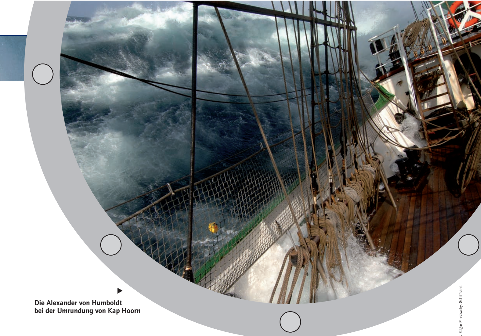
Die Alexander von Humboldt bei der Umrundung von Kap Hoorn