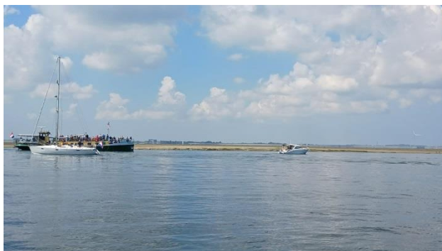
Figuur 1: MS De Eendracht, stilliggend nabij de zeehonden.

Aanvullend op wat in het proces-verbaal is opgenomen heb ik ook gewezen op het feit dat we buiten het natuurgebied geankerd lagen, met uitgeschakelde motor.